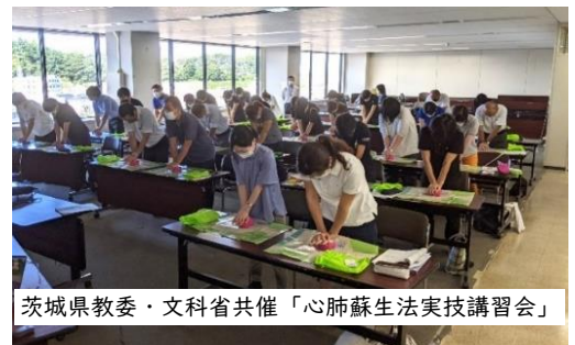
茨城県教委・文科省共催「心肺蘇生法実技講習会」

※ 身長が低い方の場合、机上で胸骨圧迫をする際、うまく力を加えられないことがあります。